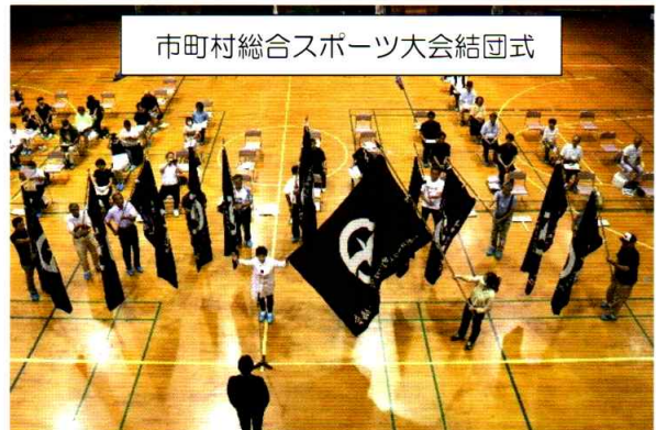
市町村総合スポーツ大会結団式